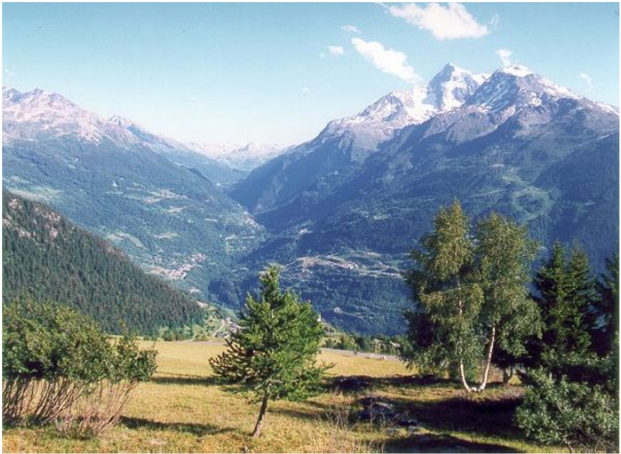
Blick Richtung Val d'Isère und den Col de l'Iséran, von den Serpentina unterhalb la Rosière